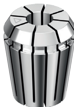
Ultra præcision ER tænger Rundløb max. 5 µm